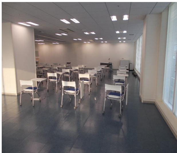
<講義・ディブリーフィング室>