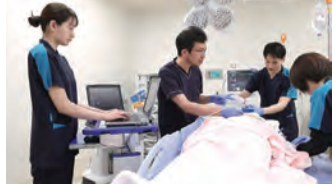
彩の国東大宮メディカルセンター初期臨床研修プログラム（募集定員7名）

常勤医師のほとんどが指導医であり、指導医をはじめ科全体、病院全体で研修医を育てる充実した指導体制をとっております。救急ローテート時や日当直では、ファーストタッチから一連の検査オーダー、診断までを研修医が主体的に行います。もちろん指導医や上級医がしっかりサポート・指導をしてくれますので安心して研修に臨むことができ、3年目独り立ちに向けて臨床能力を養うことができます。また、2020年度より必須となった産婦人科・小児科・精神科・地域医療については、専門的な知識を十分に経験できる施設と連携しています。