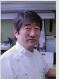
副院長/小児・周産期母子センター部長 プログラム責任者